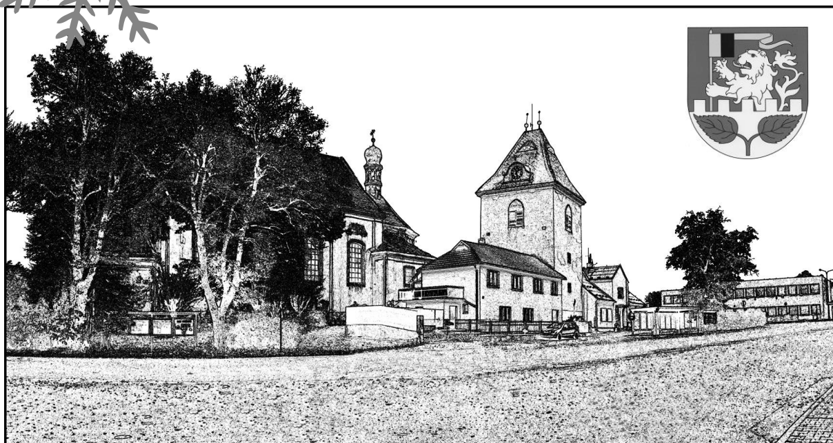
1255 - 2015 městys Březno u Mladé Boleslavi